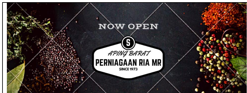
Caption: En. Mazli berjaya mereka "cover photo" facebook.