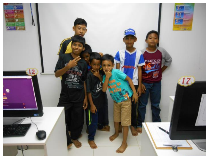
3. Para peserta.