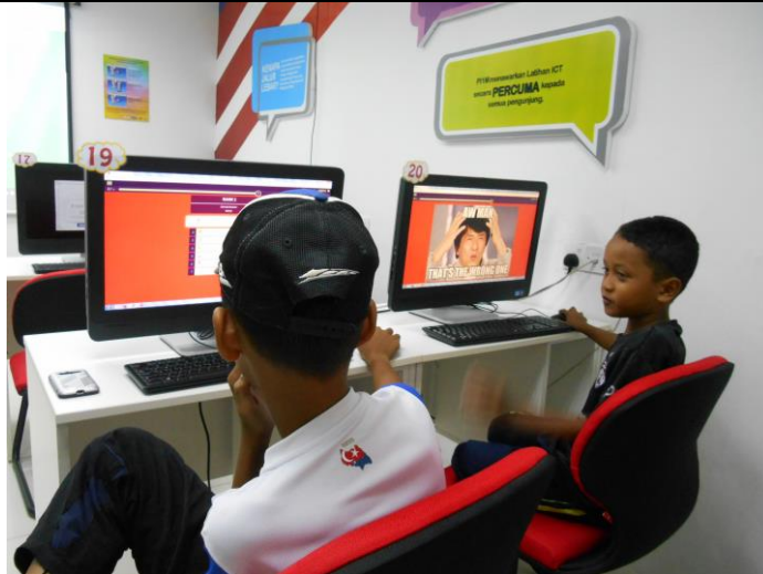
1. Peserta sedang bermain permainan pendidikan atas talian.