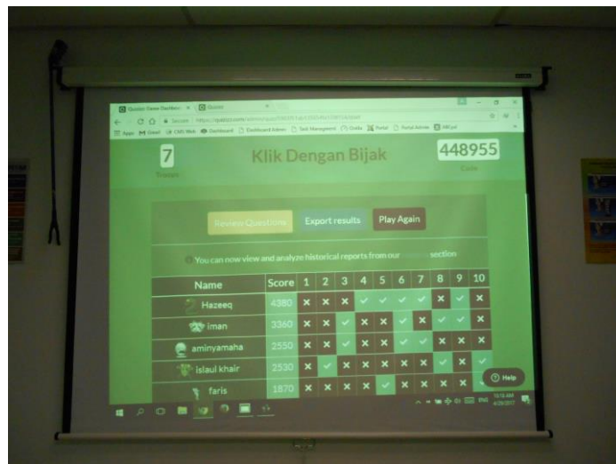
2. Ulasan kuiz selepas tamat kuiz.